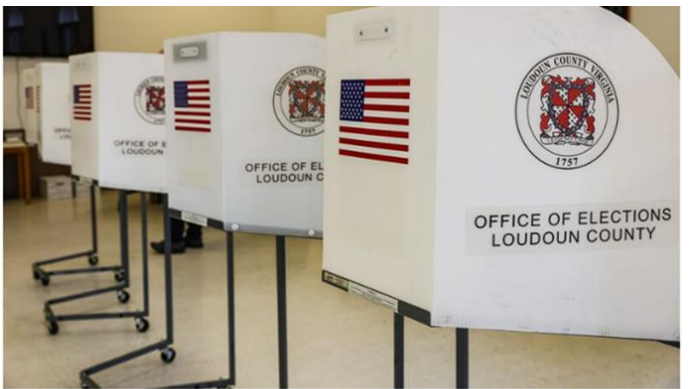
Voting booths at a polling station inside Oak Grove Baptist Church in Sterling, Virginia on Super Tuesday.

➤ การลงคะแนนเสียงเพื่อเลือก Candidate ลงแข่งเลือกตั้งปธน. สหรัฐฯของแต่ละพรรคเริ่มต้นในคืนวันอังคารที่ผ่าน มา โดยจากผลการนับคะแนนล่าสุดยังคงเป็น Trump และ Biden ที่มีคะแนนนำสำหรับการเป็นตัวแทนพรรคลงเลือกตั้งในเดือน พ.ย. ที่จะถึงนี้