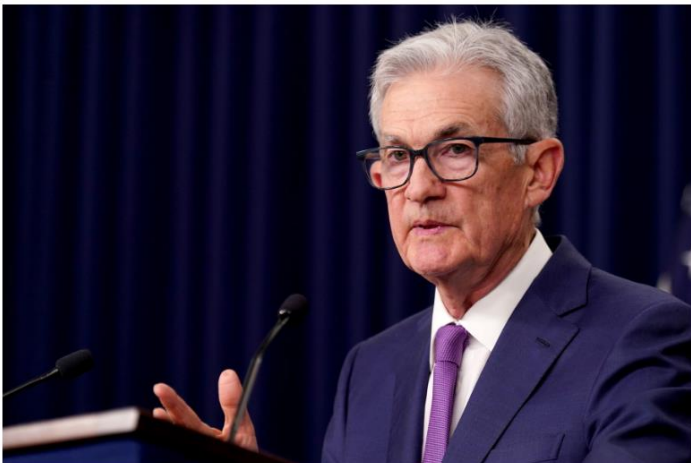
Jerome Powell