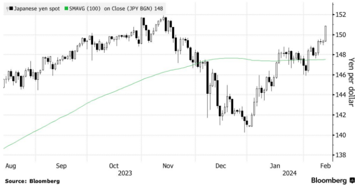
Yen Weakens Past 150 Per Dollar the First Time Since Nov