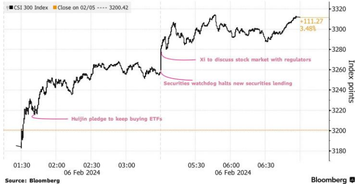
China Stocks Get Multiple Boosts

การคาดการณ์ว่ารัฐบาลจีนจะมีมาตรการที่เข้มข้นมากขึ้น เพื่อหยุดยั้งความซบเซาของหุ้น ส่งผลให้หุ้นจีนที่จดทะเบียนในสหรัฐฯปรับตัวเพิ่มขึ้น โดยดัชนี Nasdaq Golden Dragon China Index พุ่งขึ้นมากกว่า 5% ขณะที่ดัชนี CSI 300 ปิดสูงขึ้น 3.5% นับเป็นวันที่ดีที่สุดในปีตั้งแต่ปลายปี 2022 หลังจากที่ Bloomberg รายงานว่าหน่วยงานกำกับดูแลที่นำโดยคณะกรรมการกำกับดูแลหลักทรัพย์ของจีนวางแผนที่จะอัปเดตประธานาธิบดี สี จิ้นผิง เกี่ยวกับสภาวะตลาดและการริเริ่มเชิงนโยบายล่าสุด แม้ว่าจะไม่ชัดเจนว่าจะมีมาตรการสนับสนุนใหม่ๆ ออกมาจากการประชุมหรือไม่ แต่นักลงทุนก็หวังว่าครั้งนี้จะแตกต่างออกไป โดยมูลค่าประมาณ 7 ล้านล้านดอลลาร์ได้ถูกลบล้างออกจากตลาดหุ้นฮ่องกงและจีน นับตั้งแต่จุดสูงสุดในปี 2021