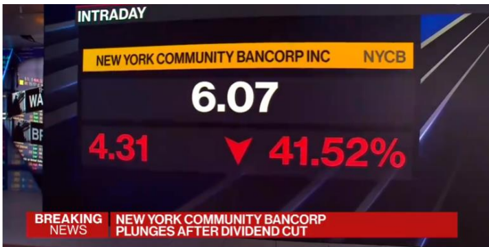
New York Community Bancorp, the regional lender that purchased deposits from Signature Bank last year, fell a record 46% after reporting a surprise loss for the fourth quarter and a cut to its dividend. Bloomberg's Manus Cranny reports.