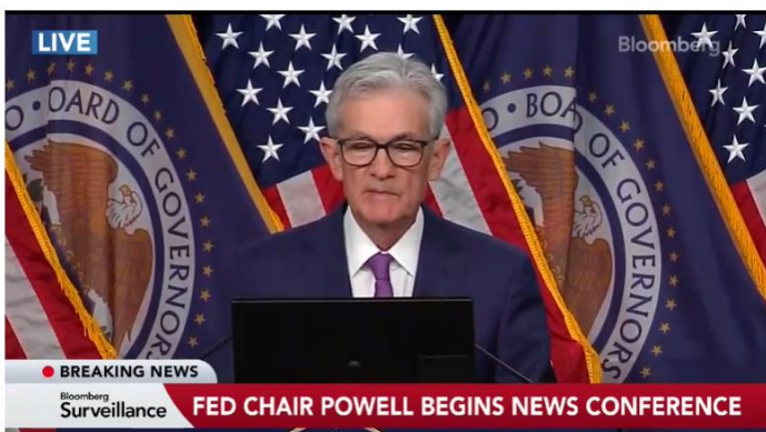
Fed Chair Powell Says Policy Rate Likely at Peak

➤ ธนาคารกลางสหรัฐ (Fed) คงอัตราดอกเบี้ยไว้ที่ระดับเดิม 5.25-5.5% เป็นการประชุมนัดที่ 4 ติดต่อกันตามที่ตลาดคาดไว้ อย่างไรก็ตาม ประธาน เจอโรม พาวเวลล์ ทำลายความหวังของนักลงทุนที่ว่าจะเริ่มผ่อนคลายนโยบายในเดือนมีนาคม แม้ว่าเขาจะส่งสัญญาณว่าธนาคารกลางพร้อมจะลดต้นทุนการกู้ยืมในเร็ว ๆ นี้ก็ตาม “จากการประชุมในวันนี้ ผมอยากจะบอกคุณว่าผมไม่คิดว่าเป็นไปได้ที่คณะกรรมการจะมั่นใจพอจะลดดอกเบี้ยเมื่อถึงการประชุมในเดือนมีนาคม” พาวเวลล์ กล่าว แต่ยอมรับถึงพัฒนาการที่ดีของอัตราเงินเฟ้ออย่างมาก และย้ำถึงความจำเป็นในการดูข้อมูลเพิ่มเติมเพื่อยืนยันแนวโน้มดังกล่าว