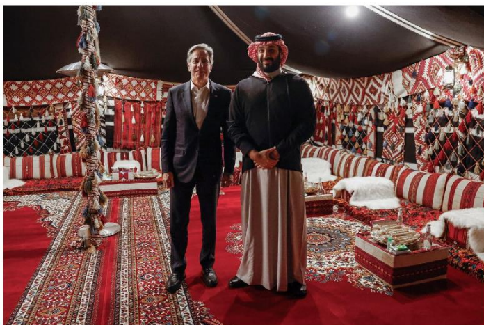
Antony Blinken with Mohammed bin Salman in al-Ula, Saudi Arabia, on Jan. 8.