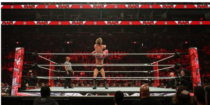
WWE Wrestlemania Raw in Phoenix, Arizona, on March 27, 2023.

Netflix ประกาศซื้อสิทธิ์แต่เพียงผู้เดียวในการฉายรายการ Raw รวมถึงรายการอื่นๆ จาก World Wrestling Entertainment (WWE) ซึ่งถือเป็นก้าวสำคัญในธุรกิจการถ่ายทอดสด โดย Netflix ได้ตกลงที่จะจ่ายเงิน 5 พันล้านดอลลาร์ตลอดระยะเวลาข้อตกลง 10 ปีซึ่งทำให้ Raw ออกอากาศทาง Netflix ในสหรัฐอเมริกา แคนาดา ละตินอเมริกา และตลาดอื่นๆ เริ่มตั้งแต่วันที่ 1 มกราคม 2025