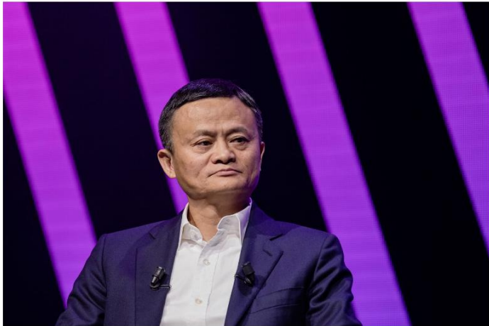
Jack Ma

10 ล้านหุ้นมูลค่าประมาณ 870 ล้านดอลลาร์ในวันที่ 21 พ.ย. ที่ผ่านมามาผ่านทางบริษัท 2 แห่งที่เขาคือเจ้าของ