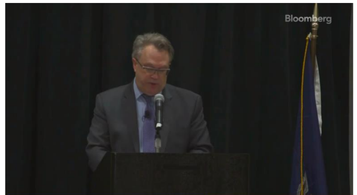
Fed's Williams: Rates Restrictive Enough to Reach Goal

▶ จอห์น วิลเลียมส์ ประธานธนาคารกลางสหรัฐ (Fed) สาขานิวยอร์กกล่าวว่าขณะนี้นโยบายการเงินมีความเข้มงวดเพียงพอที่จะนำให้อัตราเงินเฟ้อให้กลับสู่เป้าหมายของ Fed ที่ระดับ 2% แต่แนะนำว่าจำเป็นต้องมีหลักฐานเพิ่มเติมว่าอัตราเงินเฟ้อชะลอลงอย่างชัดเจนก่อนที่จะเริ่มลดอัตราดอกเบี้ย และข้อมูลดัชนีราคาผู้บริโภค (CPI) ที่จะเปิดเผยในวันพฤหัสบดีนี้ คาดว่าจะอ่อนตัวลงอีก