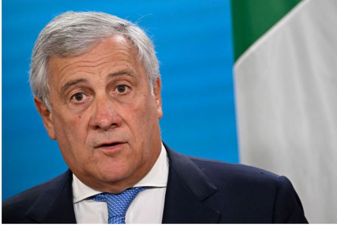
Antonio Tajani

ผลลัพธ์ที่ดีกว่า” เวกาล่าวเสริม ทั้งนี้italiaเป็นประเทศเดียวในกลุ่ม Group of Seven ที่เข้าร่วมข้อตกลงกับจีนซึ่งเปิดตัวเมื่อทศวรรษที่แล้ว