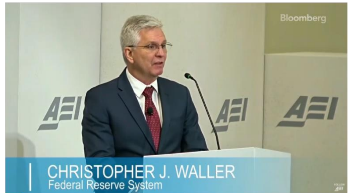
Waller Says He's Confident Fed Policy Is Well Positioned

นโยบายการเงินที่เข้มงวดมากขึ้น เพื่อให้อัตราเงินเฟ้อกลับสู่เป้าหมายของธนาคารกลางอย่างมั่นใจ