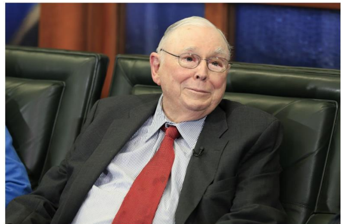
Charlie Munger in 2017.