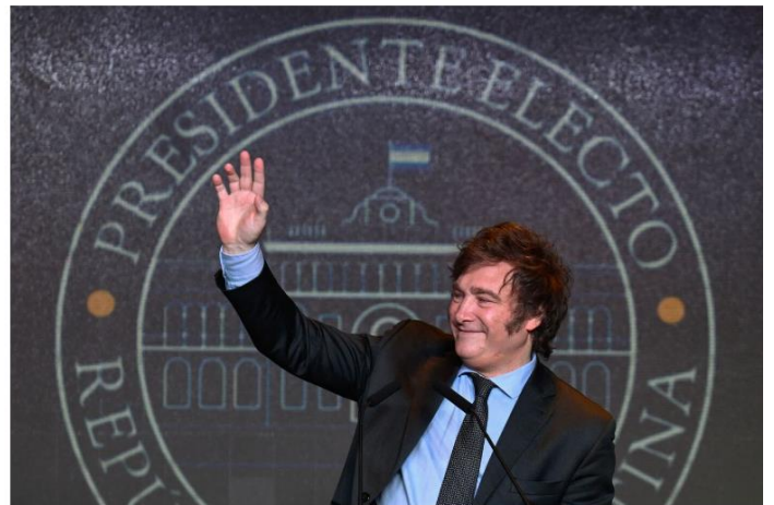
Javier Milei waves to supporters after winning the presidential election runoff in Buenos Aires on November 19.

▶ ซาบีเยร์ มิวเลย์ ผู้นำพรรคเสรีนิยมให้มุมมองที่เป็นกลางมากขึ้นนับตั้งแต่ชนะการเลือกตั้งอาร์เจนตินาเมื่อสุดสัปดาห์ที่ผ่านมา หลังจากที่ก่อนหน้านี้เขาเรียกรัฐบาลจีนว่า “นักฆ่า” ระหว่างให้สัมภาษณ์กับ Bloomberg News เมื่อเดือนสิงหาคม และบอกว่าเขาจะไม่รักษาความสัมพันธ์กับบราซิลหรือประเทศที่นำโดย “คอมมิวนิสต์” หากได้รับเลือก นอกจากนั้นมิวเลย์ยังส่งข้อความปรารภนาตถึงชาวจีนในโพสต์โซเชียลมีเดียเมื่อวันพุธ หลังจากที่ตอบจดหมายแสดงความยินดีจาก สี จิ้นผิง