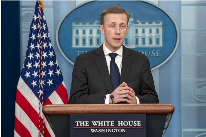
Jake Sullivan