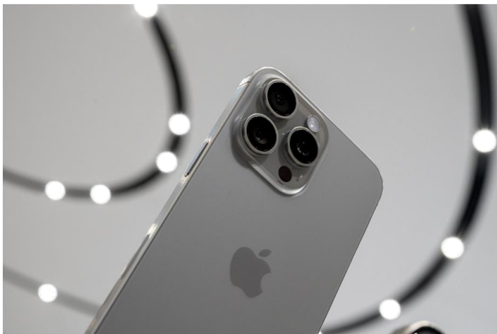
Apple's iPhone 15 Pro Max

▶ Apple เปิดตัว iPhone รุ่นล่าสุดในงานอีเว้นท์เมื่อคืนที่ผ่านมา โดยใช้วัสดุใหม่ อัปเดตกล้องและประสิทธิภาพเพื่อพยายามดึงดูดผู้บริโภคในตลาดสมาร์ตโฟนที่ซบเซา โดยบริษัทเปิดตัวโมเดลใหม่ 4 รุ่นได้แก่ iPhone 15, 15 Plus, 15 Pro และ 15 Pro Max “รุ่น Pro ของเราเป็นตัวแทนของนวัตกรรมที่ดีที่สุดของ Apple ซึ่งเป็นนวัตกรรมที่ล้ำหน้าทั้งด้านการออกแบบ กล้องประสิทธิภาพ และอื่นๆ อีกมากมาย” Tim Cook ประธานเจ้าหน้าที่บริหารของ Apple กล่าว นอกจากนี้ Apple ยังมีการเปิดตัว Apple Watch รุ่นใหม่ในงาน อย่างไรก็ตามราคาของ iPhone 15 Pro Max ที่เปิดตัวในตลาดก่อนหน้าแล้ว ทำให้หุ้นร่วงลง 1.8% สู่ระดับ 176.21 ดอลลาร์ในนิวยอร์ก