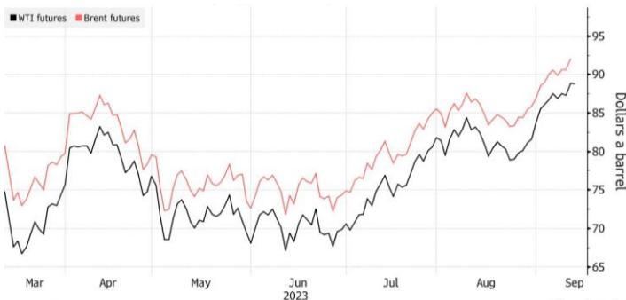
Source: ICE, Nymex OPEC data indicate a growing supply shortfall