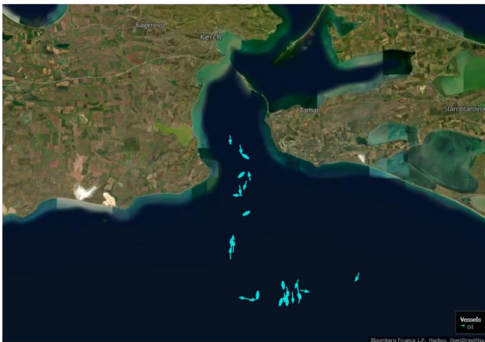
Oil tankers near Taman in Russia on July 20, 2023