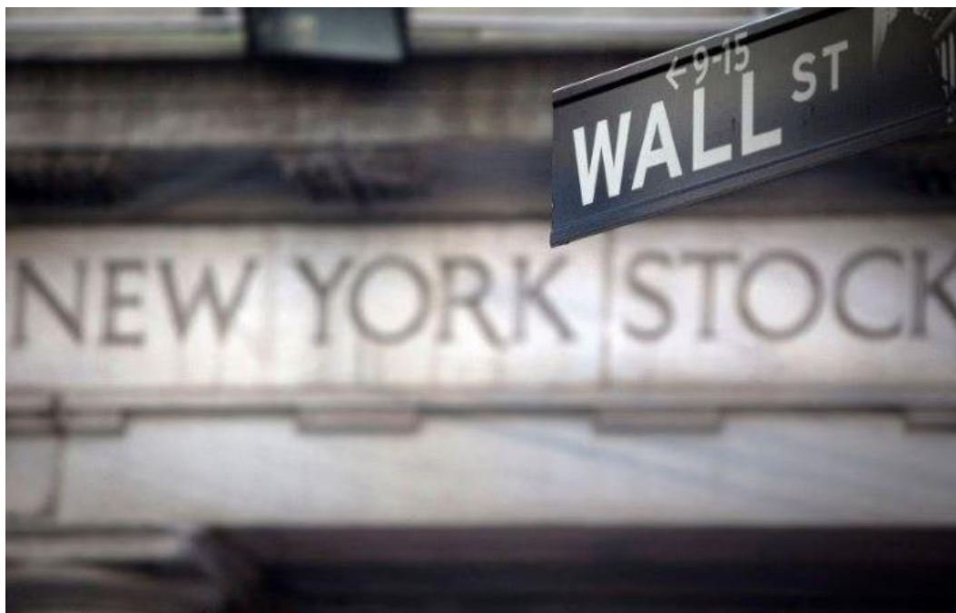
as end of March 2023.