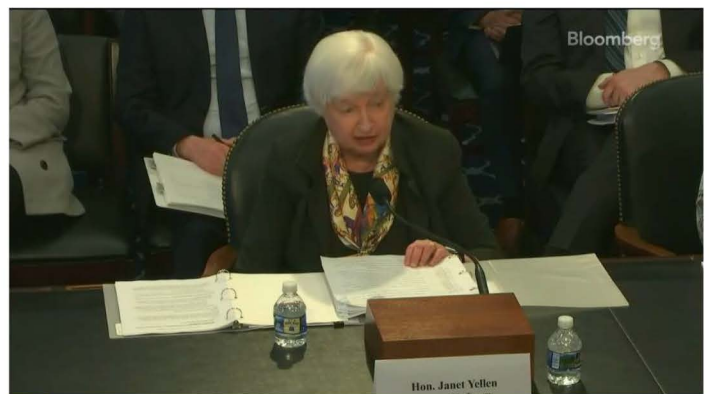
US Treasury Secretary Janet Yellen speaks before the House Appropriations subcommittee on March 23.

นาง เจเน็ต เยลเลน รัฐมนตรีคลังรายงานกับสภานิติบัญญัติของสหรัฐฯ ว่า หน่วยงานกำกับดูแลจะเตรียมพร้อมสำหรับการเพิ่มเติมมาตรการในการปกป้องระบบธนาคารหากจำเป็นหรือได้รับการร้องขอ นับเป็นการแก้ไขโดยฉับพลันในหนึ่งวันหลังจากที่เธอกล่าวสุนทรพจน์เกี่ยวกับการไม่เพิ่มมูลค่าประกันเงินฝากซึ่งสั่นคลอนความมั่นใจในการแถลงการณ์ของนาง เยลเลน เกิดขึ้นในวันพฤหัสบดี ต่อหน้าสภานิติบัญญัติโดยเธออ่านบทพูดที่เตรียมไว้ซึ่งเกือบจะเหมือนกับที่เธอรายงานในวันก่อนหน้ากับวุฒิสภา แต่เสริมข้อความว่า "แน่นอน เราจะเตรียมพร้อมเพื่อจะดำเนินการเพิ่มเติมมาตรการช่วยเหลือใดๆหากมีการร้องขอ"