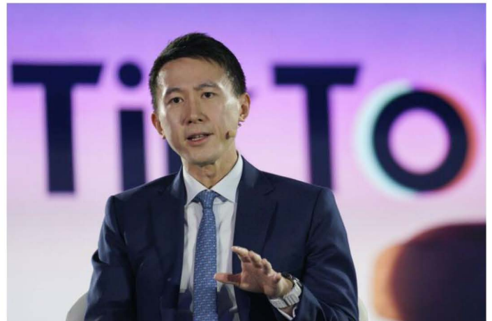
Shou Chew

คู่แข่งรายอื่นๆ และรัฐบาลจีนไม่มีอำนาจเหนือข้อมูลของตน โดยอ้างข้อโต้แย้งที่คุ้นเคยเพื่อขัดขวางการห้ามของสหรัฐฯ หรือการบังคับขาย ตามข้อมูลที่บริษัทเตรียมนำเสนอต่อสภาและผ่านการตรวจสอบโดย Bloomberg News โดย Chew จะเข้าให้การเป็นพยานต่อหน้าคณะกรรมการด้านคริวเรือน พลังงาน และการค้าในวันพฤหัสบดี ตามข้อมูลพบว่า TikTok ต้องการย้ำว่าบริษัทจะไม่เปิดเผยข้อมูลที่เรียกร้องโดยพรรคคอมมิวนิสต์ รัฐบาลจีนไม่มีอิทธิพลเหนือบริษัท ByteDance สาขาในสหรัฐฯ และสิงคโปร์