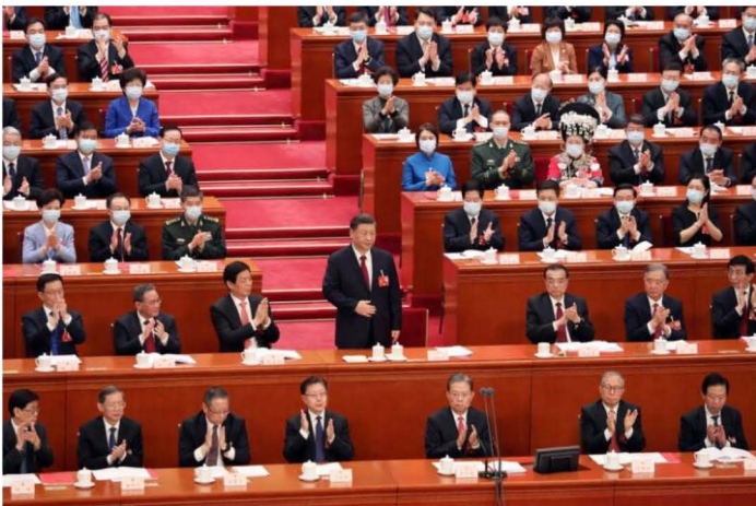
Xi Jinping during the First Session of the 14th National People's Congress in Beijing on March 13.

▶ สำนักข่าวซินหัวรายงานแผนการยกเครื่องครั้งใหญ่ของรัฐบาลจีน โดยพรรคคอมมิวนิสต์จีนวางภาคการเงินและเทคโนโลยีของประเทศเป็นหัวใจในการควบคุม หลังจากที่ประธานาธิบดี Xi Jinping กระชับอำนาจเพิ่มขึ้นในการประชุม NPC นอกจากนั้นซินหัวรายงานว่าจีนกำลังจัดตั้งคณะกรรมการการเงินกลางเพื่อเพิ่มการกำกับดูแลในภาคการเงินซึ่งมีมูลค่ากว่า 60 ล้านล้านดอลลาร์ และจัดตั้งคณะกรรมการกลางด้านเทคโนโลยีขึ้นเพื่อเสริมความแข็งแกร่งในการกำกับดูแลการพัฒนาเทคโนโลยีของพรรค ขณะเดียวกันจะมีการสร้างสำนักงานกลางสำหรับกิจการฮ่องกงและมาเก๊าแยกต่างหาก