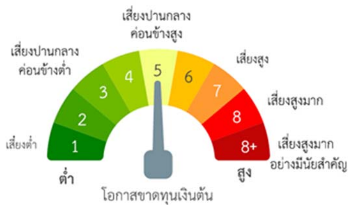
แผนภาพแสดงตำแหน่งความเสี่ยงของกองทุนรวม

- ในกรณีที่มีแนวโน้มว่าจะมีการขายคืนหน่วยลงทุนเกินกว่า 2 ใน 3 ของจำนวนหน่วยลงทุนที่กำหนดไว้แล้วทั้งหมด บริษัทจัดการ อาจใช้ดุลยพินิจในการเลิกกองทุนรวม และอาจยกเลิกคำสั่งซื้อขายหน่วยลงทุนที่ได้รับไว้แล้วหรือหยุดรับคำสั่งดังกล่าวได้