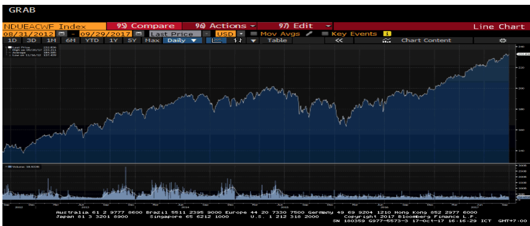
กราฟแสดงผลตอบแทนย้อนหลังภายในระยะเวลา 5 ปีของดัชนี MSCI AC World NETR USD Index

หมายเหตุ : (1) ตั้งแต่วันที่ 31 สิงหาคม 2560 – 29 กันยายน 2560