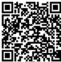
สแกนเพื่อชื้อกองทุน

บริษัทหลักทรัพย์จัดการกองทุน เอ็มเอฟซี จำกัด (มหาชน)